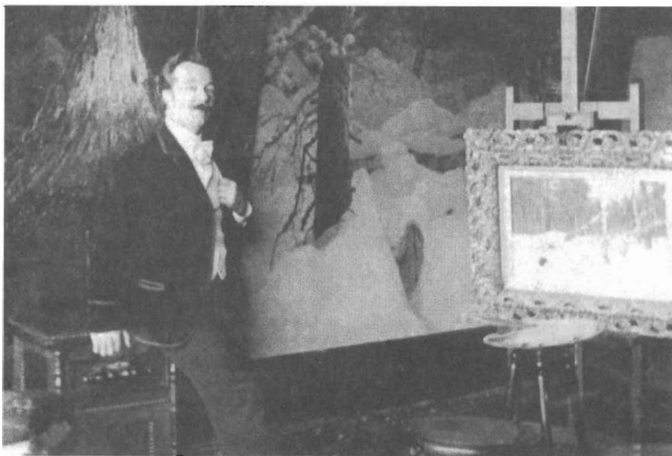
Мастерская В.Д. Вучичевича, недалеко от г. Томска, около с. Нагорного