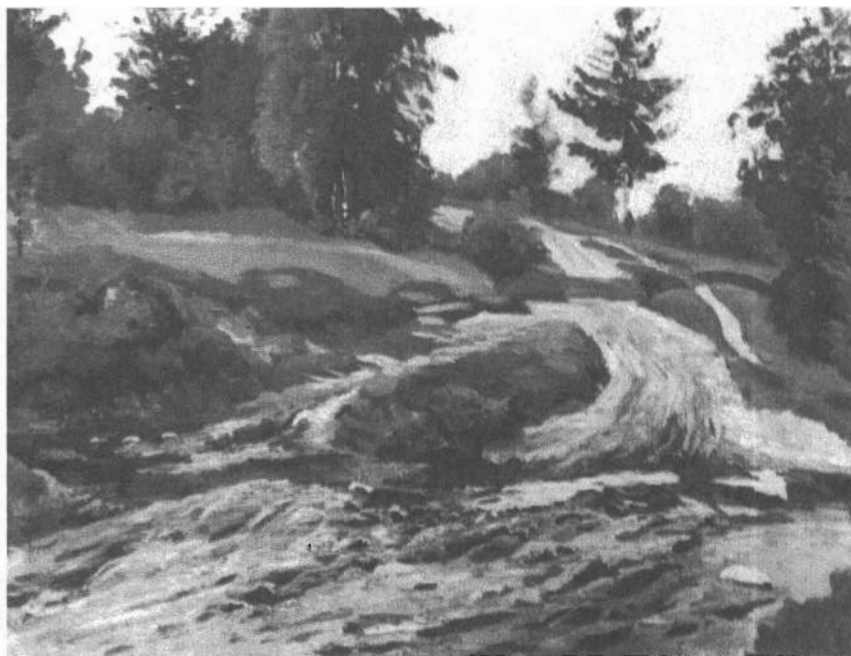
Из творческого наследия художника-пейзажиста В. Д. Вучичевича-Сибирского: «Дорога в лесу» (окрестности Барзевки)